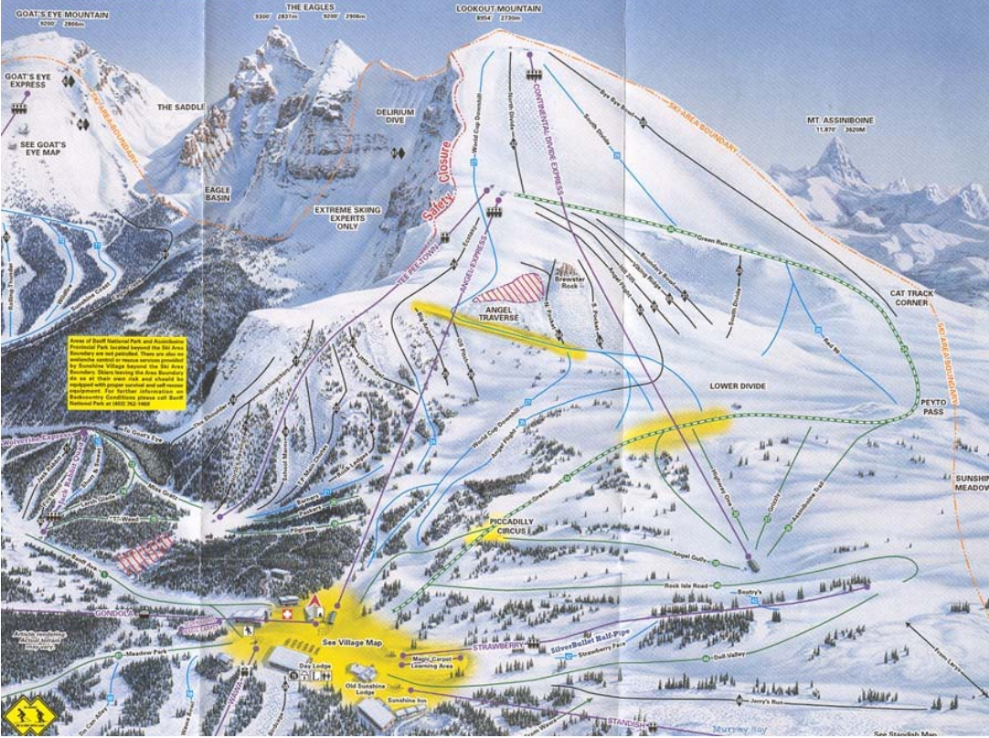
Sunshine Village Drei miteinander verbundene Skigebiete