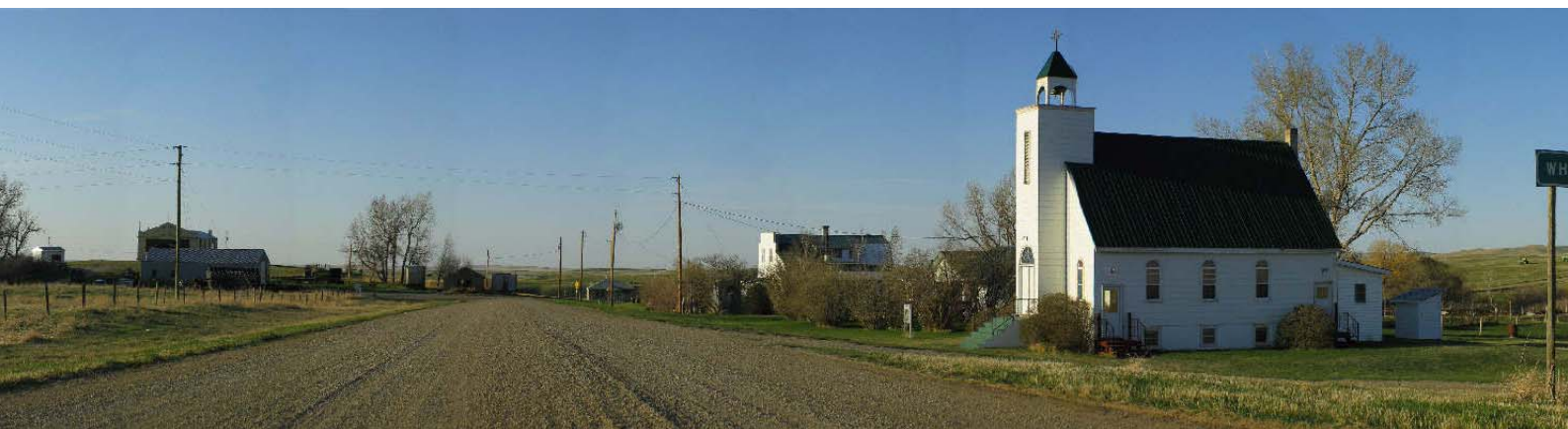
Whitlash, Main Street .....it's not the end of the world, but you can see it from here!

Kann man hier nicht wirklich sagen, dass die Zeit stehen geblieben ist? Man nehme seinen bei WalMart für $5,95 erstandenen Segeltuch-Klappstuhl mit Cupholder in der Armlehne, setze sich in den Windschatten des SUV und lasse die Umgebung auf sich einwirken, die aus Stille, wenigen Einzelheiten und vom Wind herangetragen Düften der Prärie besteht. Was meinen Sie, was man für Entdeckungen macht! – Manchmal bietet eine One-Horse-Town des Westens mehr als die Madison Avenue in der Upper East Side von New York City.