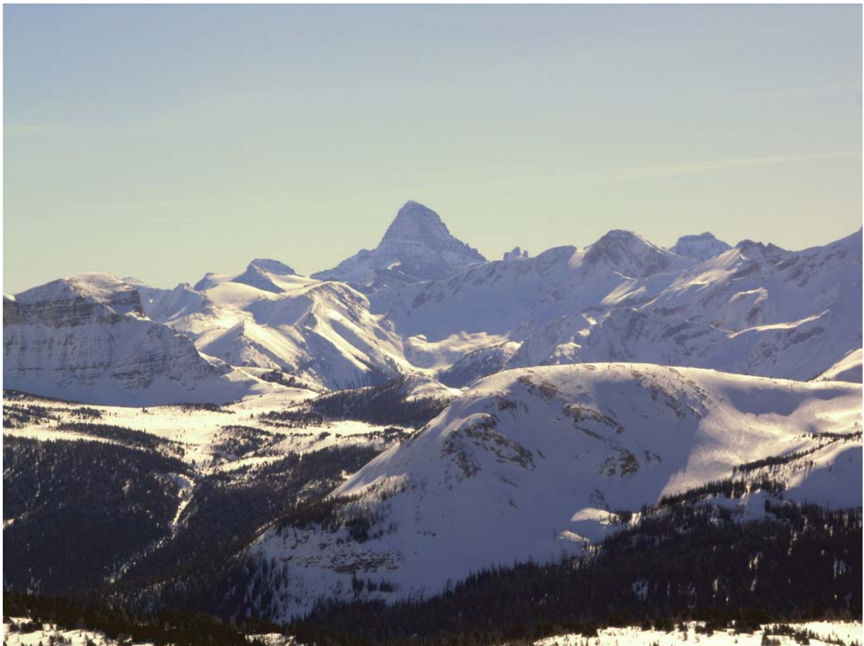
„South Divide Run“ vom Lookout Mountain, im Hintergrund der beeindruckende Mount Assiniboine (3620m)

Sunshine Village ist der absolute Horror bei schlechter Sicht (Nebel, starker Schneefall), da auf den weiten Hängen kaum Orientierungspunkte bestehen in der hochalpinen Landschaft!