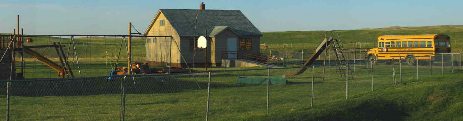
Whitlash Die Schule und der Schulbus!